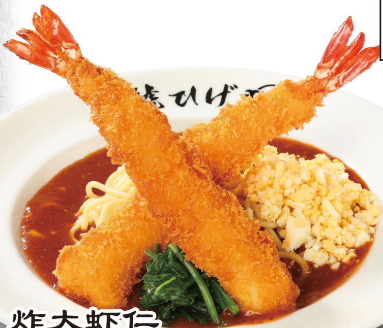
炸大虾仁 浇卤意大利面 (炸大虾仁×2、菠菜、蛋) 1,958元(含税)