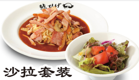
沙拉套装 (沙拉 酱油调料) +198元(含税)