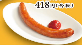
粗磨大香肠 418元(含税)