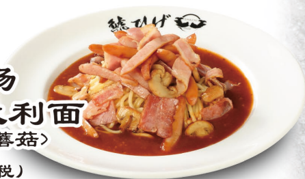
熏肉、香肠 浇卤意大利面 (熏肉、香肠、蘑菇) 1,188元(含税)