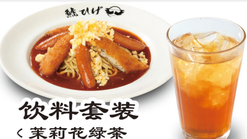
饮料套装 (茉莉花绿茶 或者 桃茶) +198元(含税)