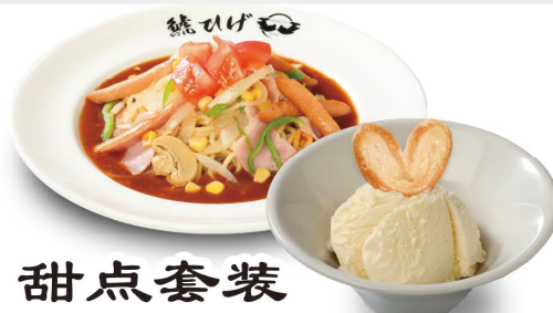
甜点套装 (香草冰淇淋) +253元(含税)