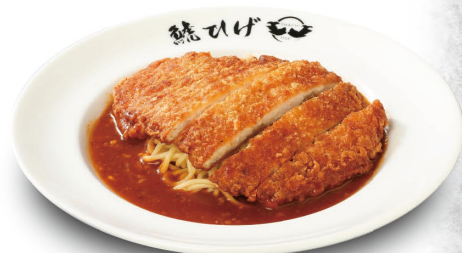
炸大鸡块 浇卤意大利面 (炸大鸡块) 1,518元(含税)