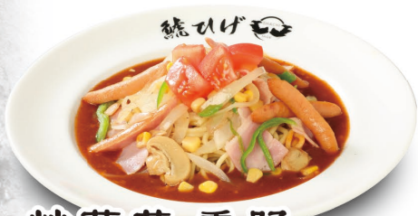
炒蔬菜、香肠 浇卤意大利面 (熏肉、香肠、青椒、蘑菇、番茄、洋葱、玉米) 1,188元(含税)