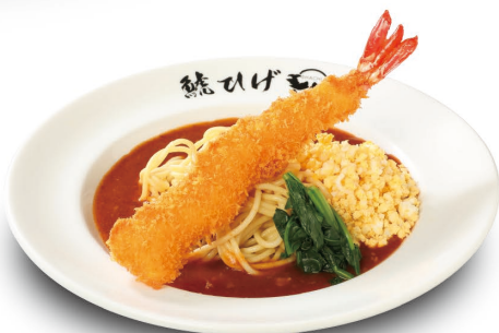
炸大虾仁 浇卤意大利面 (炸大虾仁、菠菜、蛋) 1,408元(含税)