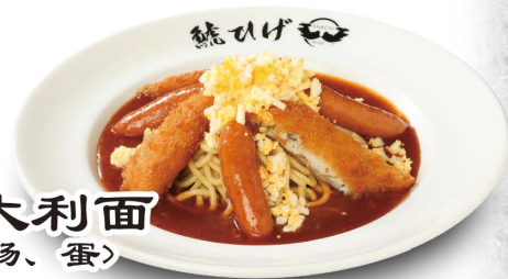
炸白鱼 浇卤意大利面 (炸白鱼、香肠、蛋) 1,078元(含税)